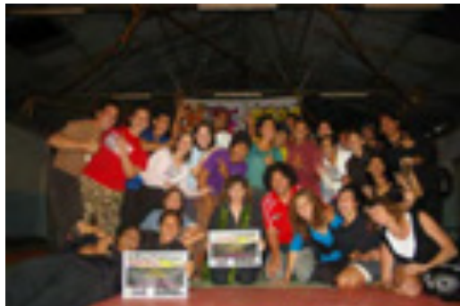
Les participants de la première résidence en 2009

En juillet 2008, « Pacifique et Compagnie... » a fait partie de la délégation calédonienne lors du 10ème Festival des Arts du Pacifique se déroulant à Pago Pago aux Samoa Américaines. La compagnie y présentait des Matches d'improvisation, d'une part pour proposer une forme théâtrale légère et interactive, d'autre part pour partager un outil de travail et un savoir-faire. Le succès de ces prestations a permis de belles rencontres. De ces rencontres, sont nés des projets d'initiation.