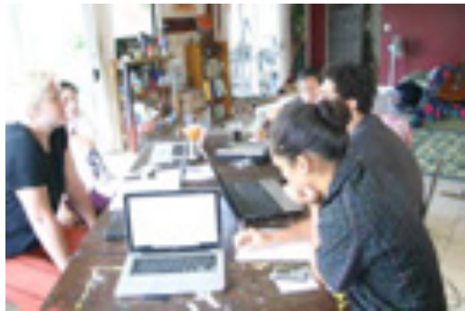
On «écrit en anglais, en Tongien... Tonga, mai 2012