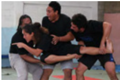
Impro sur une recherche : comment illustrer les pensées des personnages ? Tonga mai 2012