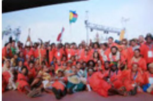
La délégation calédonienne à Pago Pago en 2008