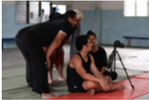
On visionne les captations et on commente... Il y a la matière nécessaire ou il faut recommencer ?