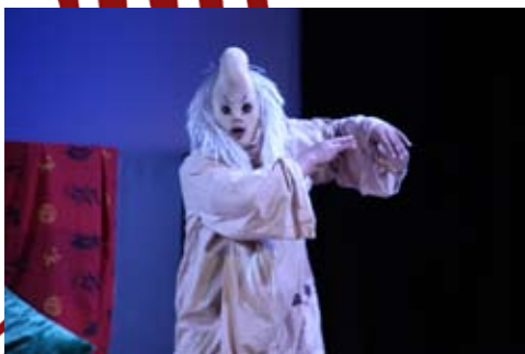
Monstres Sacrés - Tournée 2011