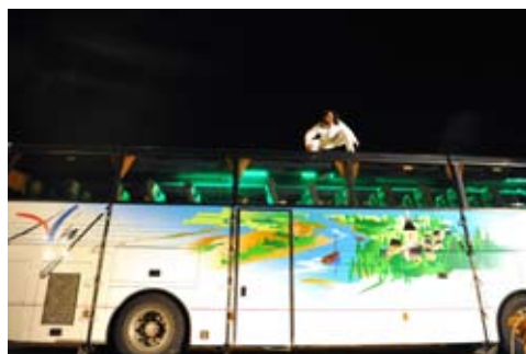
Ubus 2 - Nouville 2012