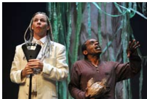
Une Tempête d'Aimé Césaire - salle Sisia - 2013